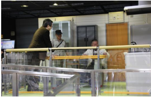
立川防災館（地震体験／東北大地震の地震）