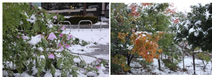
雪の重みで倒れた皇帝ダリア