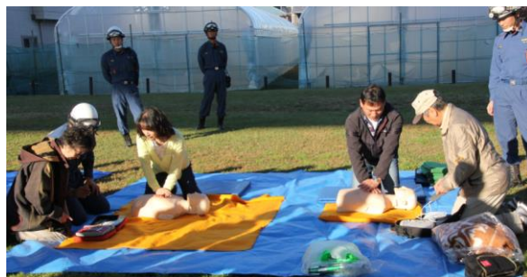
みなみ野二丁目町会防災訓練（AED訓練風景）

また、みなみ野三丁目町会で東京消防庁立川防災館の体験見学会を計画いたしました。しかし参加者が少なく中止となりました。代わりとして会長・副会長・常任理事で11月13日（日）に体験見学に行きました。