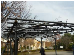
藤棚が綺麗になりました