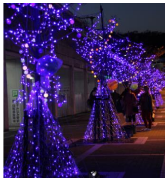
中央通りのイルミネーション「惑星」