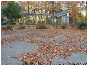
落ち葉がいっぱいの公園も綺麗になりました