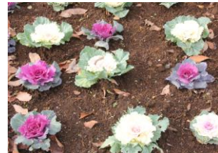
葉牡丹が植えられていました