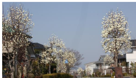
みなみ野保育園並木及び櫻公園への並木のモクレン