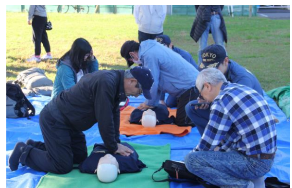
起震車体験、煙体験及び応急救護(心肺蘇生・AED)訓練