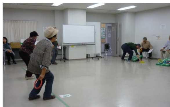
文化展、輪投げ大会