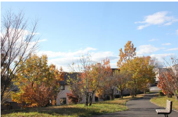
公園の皇帝ダリアと紅葉