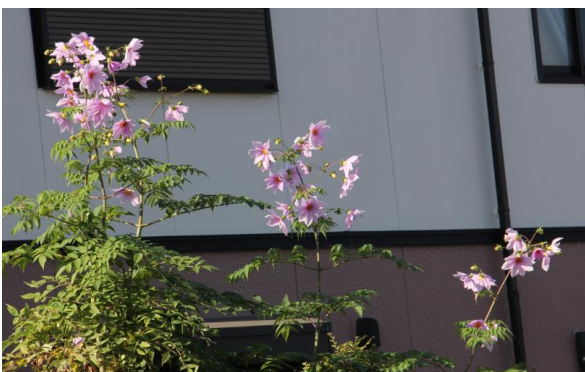
公園の紅葉、皇帝ダリア