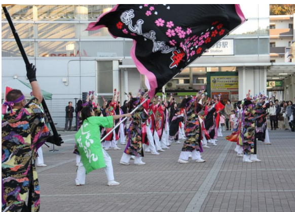
みなみ野三丁目のイルミネーション(昼間と夜の顔)、 駅前でのジョイソーランの踊り