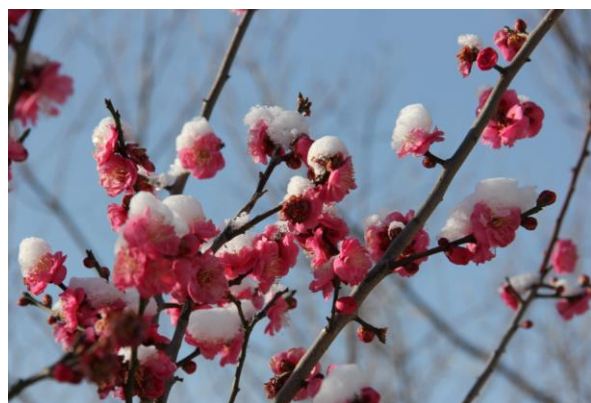
公園に積もった雪、モモの花に積もった雪