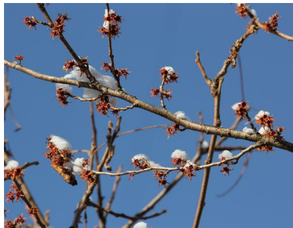
マンサクに積もった雪

これから暖かくなりますと公園にも色々な花が咲き、目を楽しませてくれることと思います。