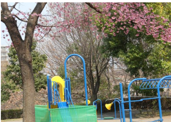
上:改装工事中の遊具